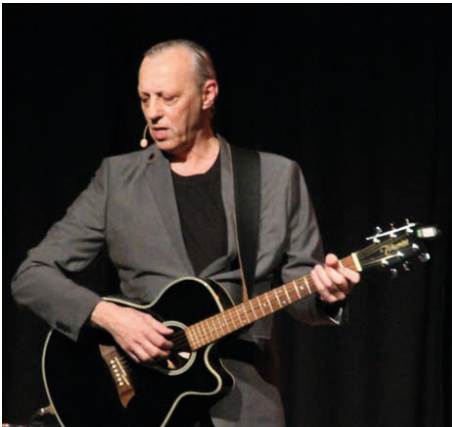
Tom Novembre a gardé de nombreux fans en Lorraine réunis à Liverdun le 9 janvier

Il s'appelle Tom Novembre comme le mois de novembre. On lui a collé différentes étiquettes : chanteur, acteur, auteur, toutes valables puisqu'il joue sur tous ces registres depuis une trentaine d'années. Avec sa voix grave qu'on retient sans peine et ses yeux globuleux qu'on reconnaît vite, on dit en général de ce genre de fantôme déambulant dans le paysage médiatique que c'est un personnage à part et Tom Novembre s'accommode de cette situation avec brio. Après un passage remarqué au Festival OFF d'Avignon 2014, Tom Novembre a (re)conquis son public avec son nouveau spectacle « Le Récital ». C'est à Liverdun qu'il a choisi de faire halte pour sa tournée provinciale début janvier. Près de 400 personnes sont venues au centre Bianchi pour ce one-man show écrit et interprété par l'artiste originaire de Nancy qui a gardé de nombreux fans sur les terres de ses premières scènes. Un spectacle pour lequel il a réuni tous ses talents dans les personnages qu'il interprète de sa voix unique au gré de ses chansons à texte qui a fait l'unanimité du public. Actuellement Tom Novembre se produit au Théâtre Trévisé à Paris.