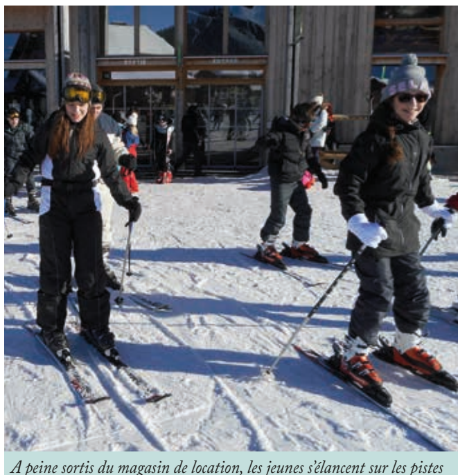
A peine sortis du magasin de location, les jeunes s'élancent sur les pistes

Une vingtaine de jeunes Liverdunois ont pu profiter d'une belle journée à Gérardmer pendant les vacances de février. Au programme ski alpin ou luge et raquettes. Cette sortie fait partie de la programmation élaborée pour les adolescents et les pré-adolescents et s'inscrit dans le cadre de notre partenariat avec l'Aoreven spécialisée dans les centres pour les jeunes.