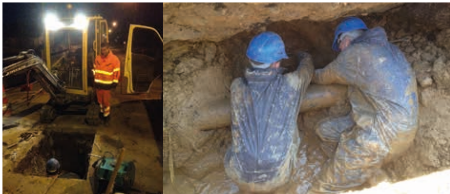
Un travail de jour comme de nuit, par tous les temps et dans des conditions souvent pénibles

CCAS / Maison de la Solidarité : 03.83.24.60.60