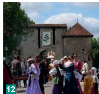
1- Les baladins du Méliador savent percer la foule / 2 - Aiguiser une lame / 3- Les tentes sont plantées / 4 - Ouverture officielle / 5 - les Cavaliers de la Ferme du Patureau / 6 - Sur le fil / 7 - Chaud devant / 8 - Bien protégés / 9 - La boulangerie / 10 - Jeu de palet / 11 - Accueil en musique / 12 - Cité médiévale en fête