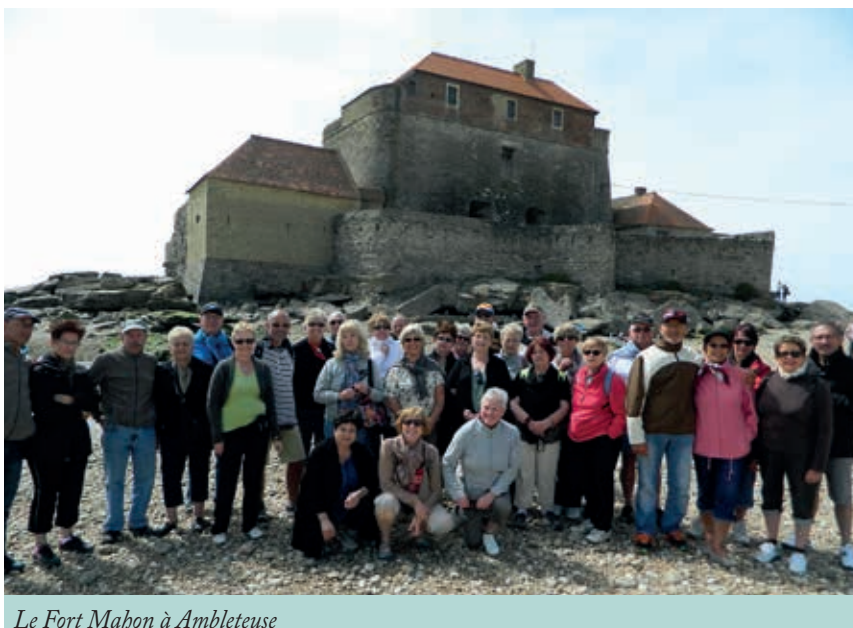
Le Fort Mahon à Ambleteuse

Le prochain voyage aura lieu fin septembre, destination le Val de Loire. Inscriptions à la Maison de la Solidarité : 03 83 24 60 60.