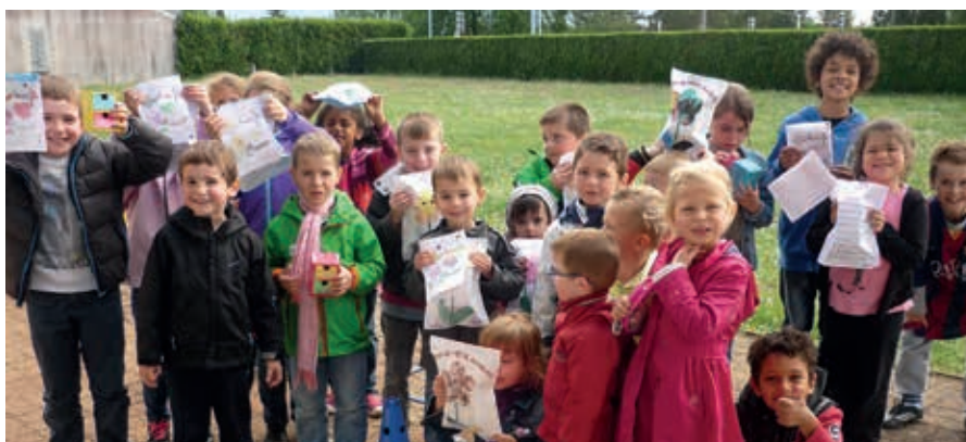
Travaux créatifs à l'occasion de la Fête des mères

Le programme est voulu très varié de manière à ce que les enfants utilisent la coupure du mercredi après-midi pour se détendre. Après plusieurs mois d'observation, les animateurs constatent que les petits sont demandeurs d'activités calmes. Les plus grands vont davantage vouloir se défouler, si possible en plein air.