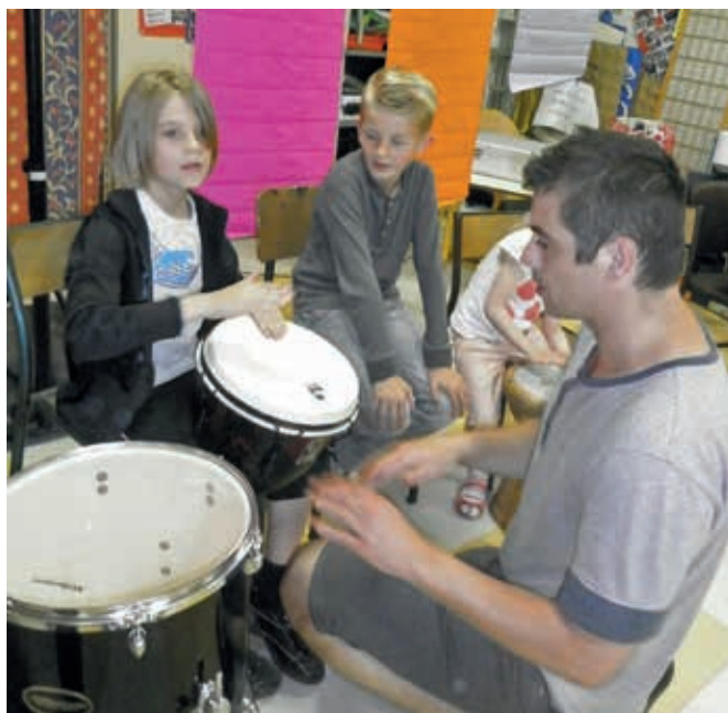
A peine sortis du magasin de location, les jeunes s'élancent sur les pistes

Rien de tel qu'après une journée de classe que de s'amuser et de découvrir de nouveaux univers. Dans cet esprit, le service d'accueil périscolaire propose sur la tranche horaire de fin d'après-midi des animations en partenariat avec des parents, des commerçants ou des associations locales. La troupe «Thaumabaco» du foyer d'adultes handicapés de Thiaucourt a fait passer un après-midi extraordinaire aux enfants avec un spectacle et une initiation aux percussions. Merci pour cette belle énergie !