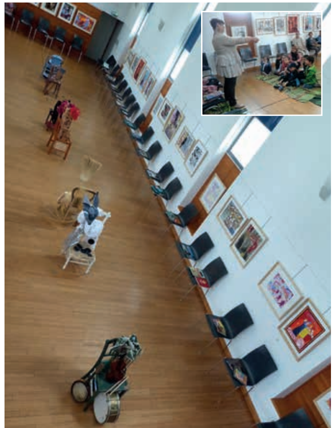
Les CP de Liverdun ont profité de l'événement dans le cadre des NAP