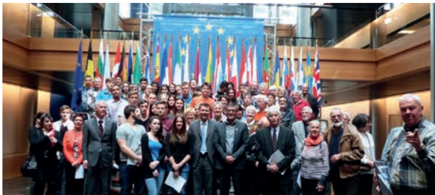
Les comités de jumelage de Weingarten et de Liverdun après la séance du 29 avril.