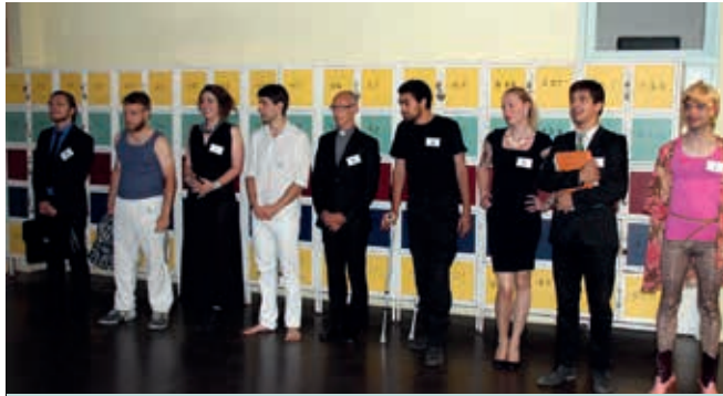
Les comédiens attendent les délibérations du jury