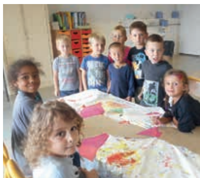
Premier Accueil Collectif de Mineurs cet été à l'Espace Picasso.

La municipalité guidée par sa volonté de maîtriser les coûts de fonctionnement a entrepris d'optimiser le ratio surface / entretien des bâtiments communaux. Sur le volet associatif, nous avons veillé à maintenir et à améliorer quand c'était possible, la qualité d'accueil des associations qui bénéficiaient déjà d'un local. Suite à cette restructuration, 7 associations ont vu déménager. La MJC Claude Gellée a intégré l'Espace Picasso (ancienne médiathèque) en juillet. En janvier 2016, ABELL, Créative et les Z'accroscènes actuellement à l'Ancienne Mairie intégreront les locaux municipaux de la rue du Cimetière conjointement avec la MPT. Les compagnons du rêve sont transférés au 6 place de la fontaine, le cercle généalogique au château Corbin. Quant aux vestiaires des restos du cœur, les permanences seront désormais à la maison Guémati (place de la Fontaine). Lors des divers déménagements, les associations ont toutes bénéficié d'une rénovation et d'un aménagement des nouveaux espaces qui leur sont alloués.