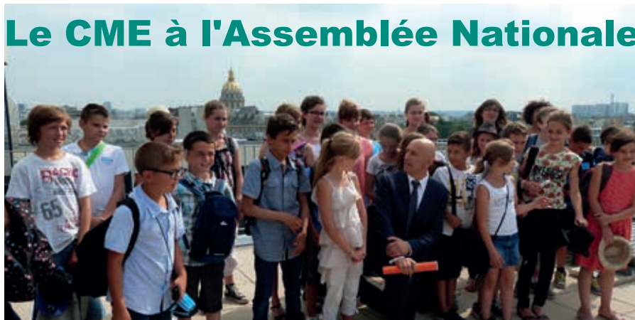
Les membres du conseil municipal d'enfants de Liverdun et de Foug autour de Dominique Potier

Les jeunes élus de Liverdun et leurs confrères de Foug ont passé une merveilleuse journée le 2 juillet. Invités par Dominique Potier, député de la 5 e circonscription de Meurthe et Moselle, ils ont découvert le fonctionnement de