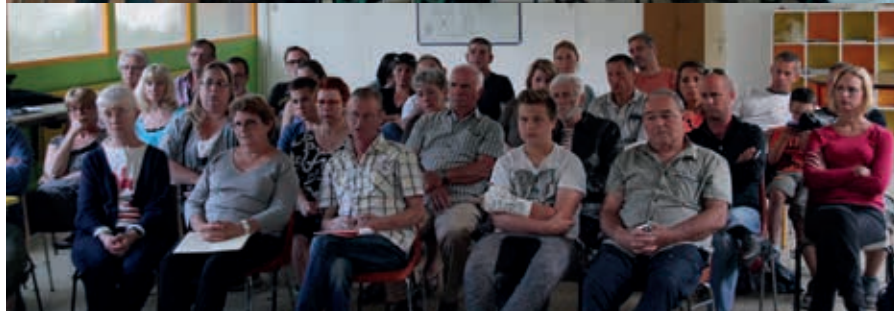
Assemblée de quartier du Rond-Chêne le 17 juin 2015

SÉBASTIEN DOSÉ, PREMIER ADJOINT EN CHARGE DE L'URBANISME ET DE LA DÉMOCRATIE DE PROXIMITÉ, FAIT LE POINT SUR L'ACTUALITÉ DES ASSEMBLÉES DE QUARTIERS.