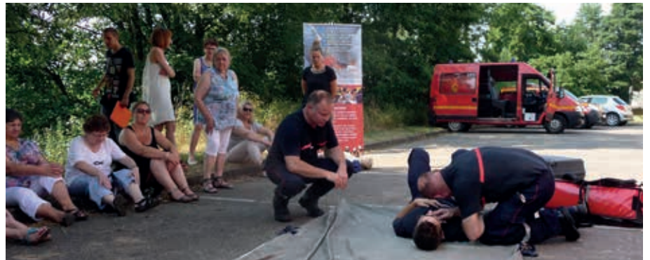
Les équipes du SDIS démontrent comment se comporter face au danger.

Si vous n'êtes pas encore inscrit(e) sur les listes électorales, vous pouvez le faire jusqu'au 30 septembre . Pour cette démarche, il suffit de présenter au service état civil de la mairie une pièce d'identité en cours de validité et un justificatif de domicile de moins de 3 mois.