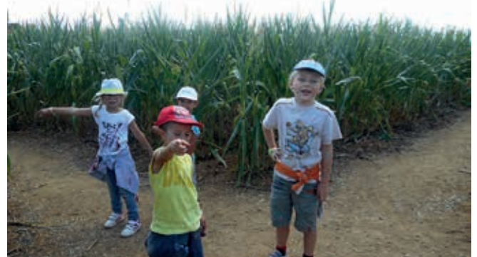
Tout droit ou à droite ?

Les enfants de Liverdun ont bénéficié cet été encore de deux mois d'animation par le service jeunesse. Les petits accueillis jusqu'alors rue de Nancy ont inauguré l'espace Picasso entièrement réaménagé pour leurs activités. Au mois de juillet, ils sont évolués au pays des celtes entre légende et magie en avant goût du festival Celt'in Lor qui va inonder notre territoire de musique pendant 10 jours. En août, c'est une balade enchantée qui a été proposée par l'équipe d'animation avec une nouvelle sortie très appréciée au labyrinthe de maïs de Puzieux. Prochaine cession du 19 au 23 octobre.