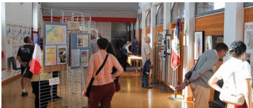
Exposition Le temps du souvenir au Château Corbin