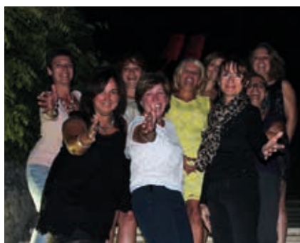
Des femmes pleines de vie au service de leur ville

en organisant une marche familiale solidaire à Liverdun. En novembre, vous les retrouverez mobilisées pour la Banque Alimentaire. La joyeuse équipe des Talentueuses n'a pas fini de vous surprendre et vous attend pour démontrer que les liverdunois sont formidables.