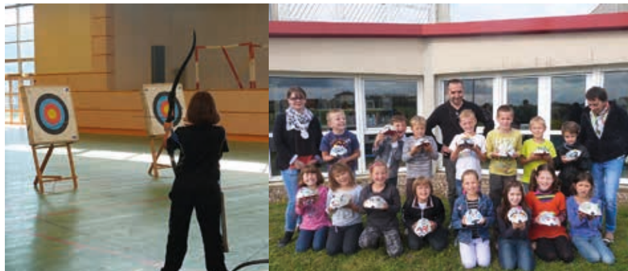
De nouvelles activités attractives. Ici du tir à l'arc pour les CM2 et du travail manuel à la médiathèque en CP