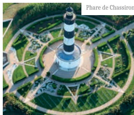
Phare de Chassiron