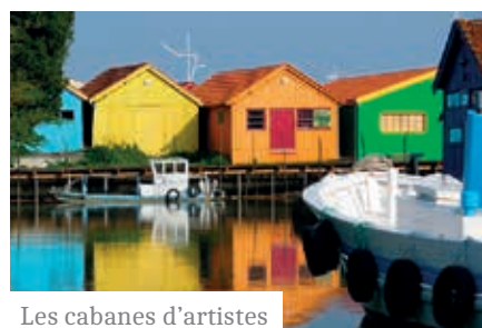
Les cabanes d'artistes

Oléron la lumineuse se révèle : sa beauté encore sauvage, ses immenses plages de sable fin, ses forêts de pins et de mimosas et son air sauvage. Profitez de ce voyage ressourçant avec un programme de visites diversifié sur l'île mais aussi dans les environs. Vous serez logé dans un complexe chaleureux qui développe une cuisine du terroir intéressante.