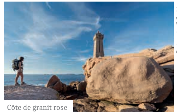
Côte de granit rose