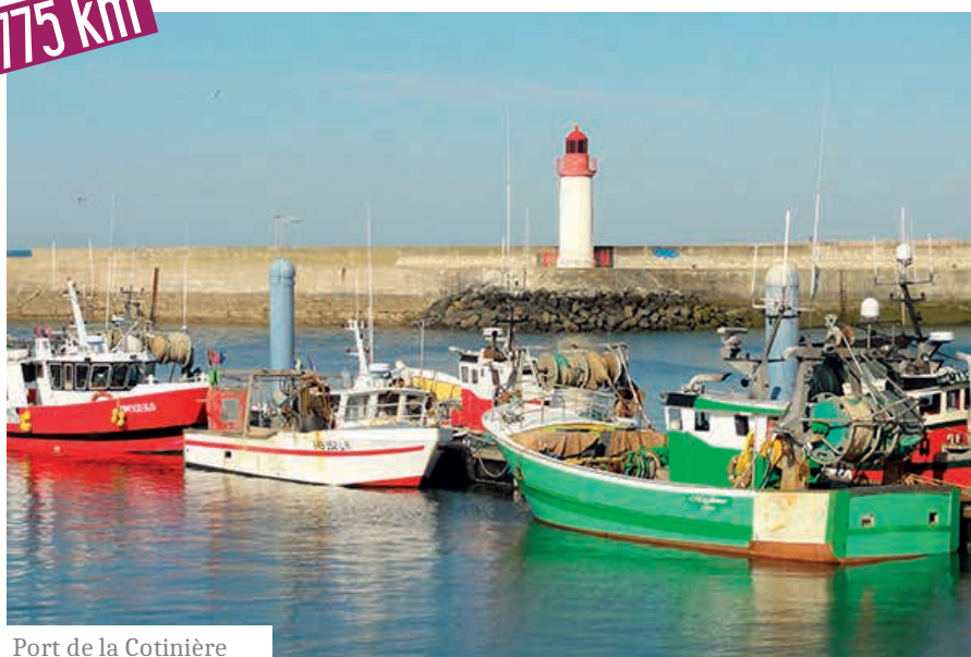
Port de la Cotinière

Oléron la lumineuse se révèle : sa beauté encore sauvage, ses immenses plages de sable fin, ses forêts de pins et de mimosas et son air sauvage. Profitez de ce voyage ressourçant avec un programme de visites diversifié sur l'île mais aussi dans les environs. Vous serez logé dans un complexe chaleureux qui développe une cuisine du terroir intéressante.