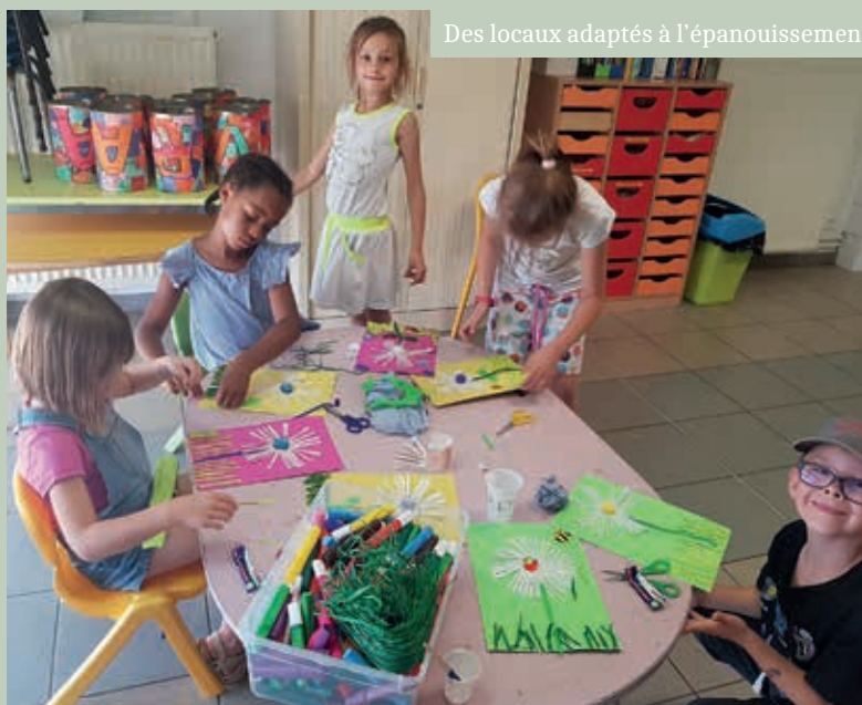
Des locaux adaptés à l'épanouissement