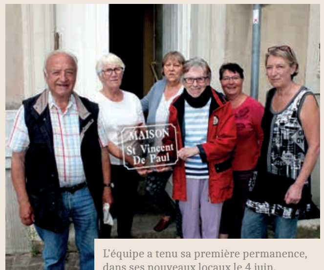
L'équipe a tenu sa première permanence, dans ses nouveaux locaux le 4 juin.

Toutes les associations locataires du 39 avenue du Gard sont désormais relogées. Si le déplacement de «Cultures et Partages» à Pompey avait rapidement été organisé, la solution pour l'amicale des donateurs de sang et surtout pour la Conférence St-Vincent de Paul, a demandé plusieurs mois de recherche. Il fallait trouver un local qui réponde aux normes sanitaires de la distribution alimentaire pour cette structure caritative qui soutient humainement et financièrement des familles en difficulté. La ville de Liverdun les accueille dans deux appartements au 6 place de la fontaine, qu'elle louait auparavant à des particuliers. L'équipe de St-Vincent de Paul est déjà installée, les donateurs de sang les suivront début juillet. Permanences St-Vincent de Paul : 2 e et 4 e mardis de chaque mois (Fermé en juillet et août).