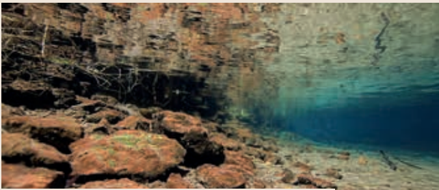
La transparence des paysages subaquatiques... prise à côté de chez vous : à Aingeray

Faune et Flore Aquatiques de Lorraine est une association basée à Liverdun. Elle regroupe des passionnés de nature (apnéistes, vidéastes, photographes, géologues, spéléologues)... engagés dans la protection des écosystèmes d'eau douce. Une aventure de citoyens mobilisés pour leur territoire avec l'envie de dévoiler les beautés insoupçonnées de nos étangs, nos rivières... Un univers subaquatique fourmillant de vie animale et végétale qu'ils font découvrir depuis 6 ans à travers leurs films documentaires. Fortement investis auprès des organismes publics régionaux, le parcours de ces bénévoles les amène de conférences en expositions à porter un nombre impressionnant de projets à vocation pédagogique. Nous avons déjà eu la chance en janvier 2017 de conduire une belle exposition à l'occasion de la sortie de leur film sur la réserve naturelle régionale de Lachaussée (55) vue par des milliers de visiteurs dont plus de 600 scolaires.