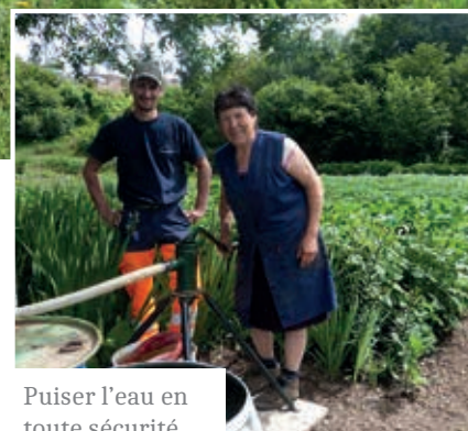
Puiser l'eau en toute sécurité.

Cent quatorze parcelles sont actuellement louées aux habitants, une priorité à la location (10 € par an) est accordée à celles et ceux qui n'ont pas de jardin et souhaitent cultiver. Quatre parcelles sont encore disponibles, pour tous renseignements, demander en Mairie Mme Olivier (service urbanisme).